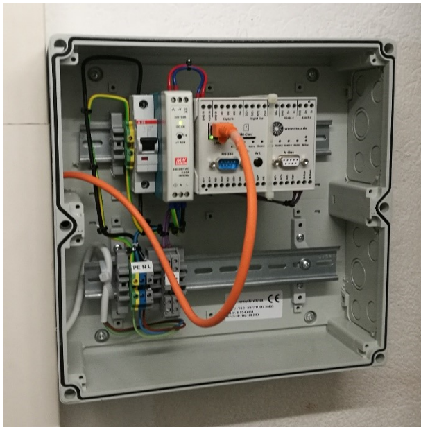
Datenlogger im Einsatz

Haben Sie Interesse, Ihre automatisch erfassten Zählerdaten unkompliziert in IngSoft InterWatt zu importieren? Dann melden Sie sich bei uns .