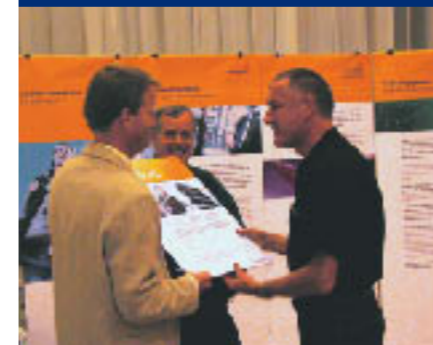
Le certificat: une récompense pour les abonnés d'energho

"energho apporte, avec ses prestations au service des bâtiments du secteur public, une contribution importante au succès de SuisseEnergie". Hans-Luzius Schmid, directeur du programme SuisseEnergie et directeur suppléant de l'Office fédéral de l'énergie, souligne ainsi l'importance de l'association. Les mesures prises depuis 1990 ont permis d'économiser six pour cent de la consommation suisse d'énergie en 2002, l'équivalent de 1,4 milliards de francs.